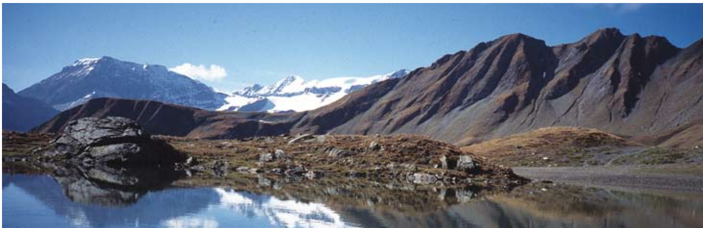
Plattensee, Trinserhorn, Piz Segnas, Piz Sardona