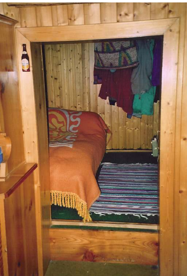
Schlafzimmer, Doppelbett und Kajütenbett (Nordische Duvet)