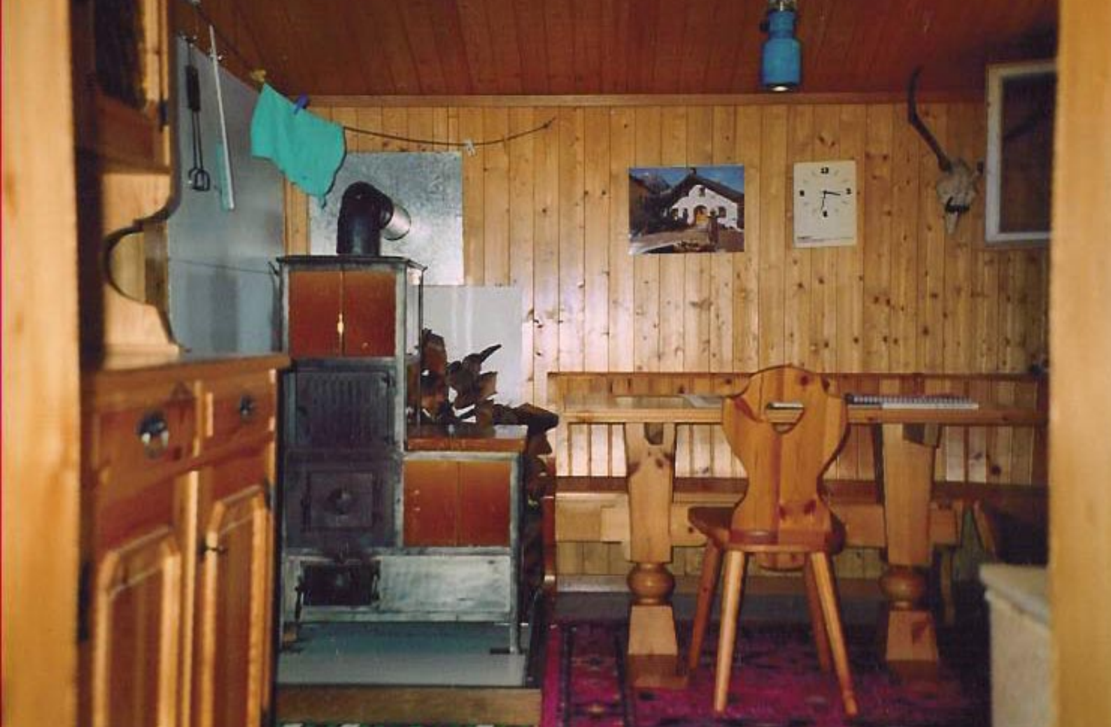
Gemütliche Arvenholzeinrichtung, perfekt funktionierender Holzofen mit Sitzgelegenheit