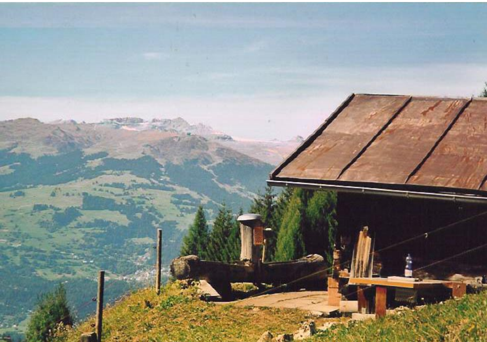
Sicht Richtung Süden, Sitzplatz neben der Hütte, im Hintergrund das Gebiet Flims / Laax