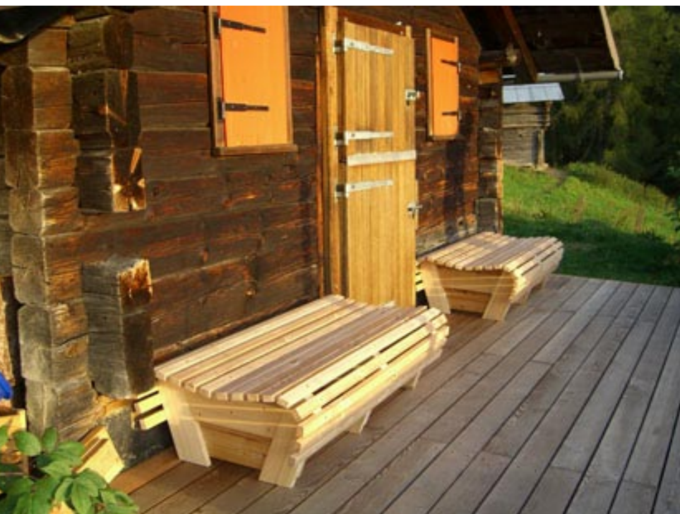
Platz vor der Hütte mit Sitzbänken