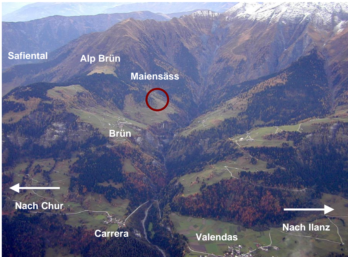
Sicht von der gegenüberliegenden Talseite