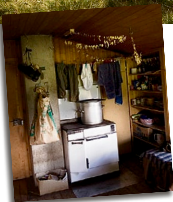
Spartanisch, aber mit Steinpilzen: Mit dem alten Holzofen wird gekocht, geheizt und warmes Wasser gemacht