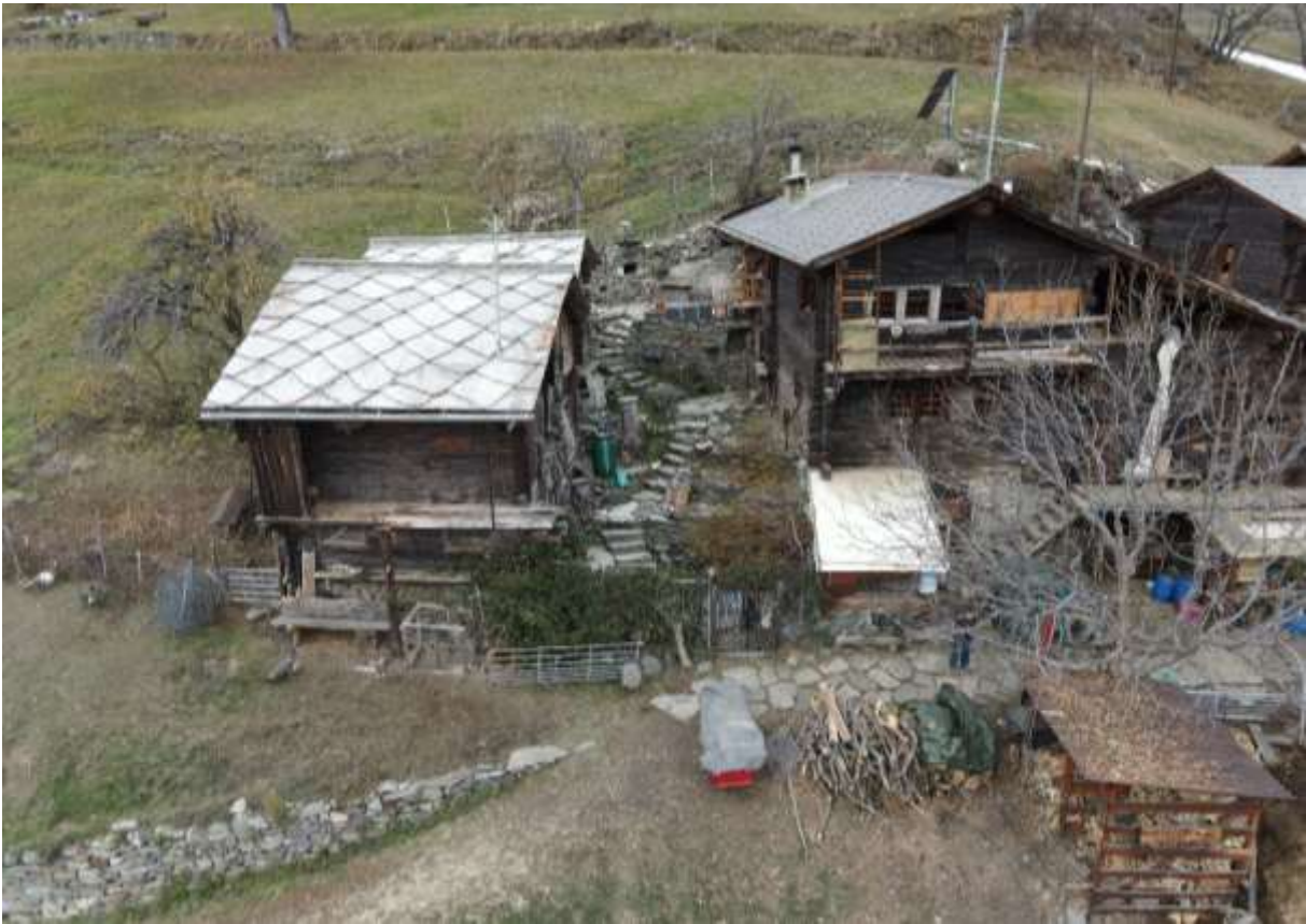
Wohnhaus rechts, Ställe und Scheunen links