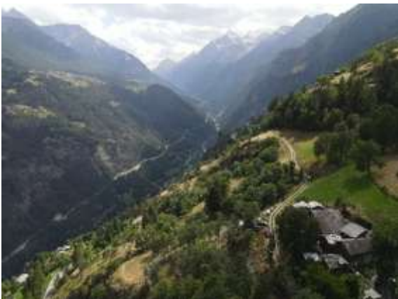
Blick ins Mattertal