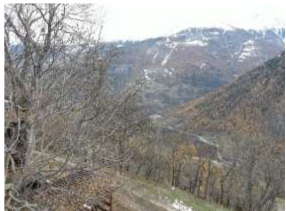
Blick zum Saastal